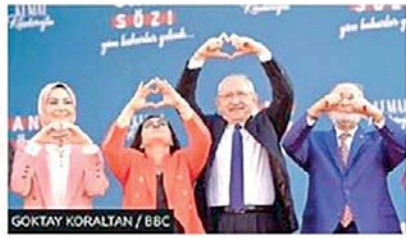
Opposition candidate Kemal Kılıçdaroğlu (second from the right) is polling ahead of President Recep Tayyip Erdoğan