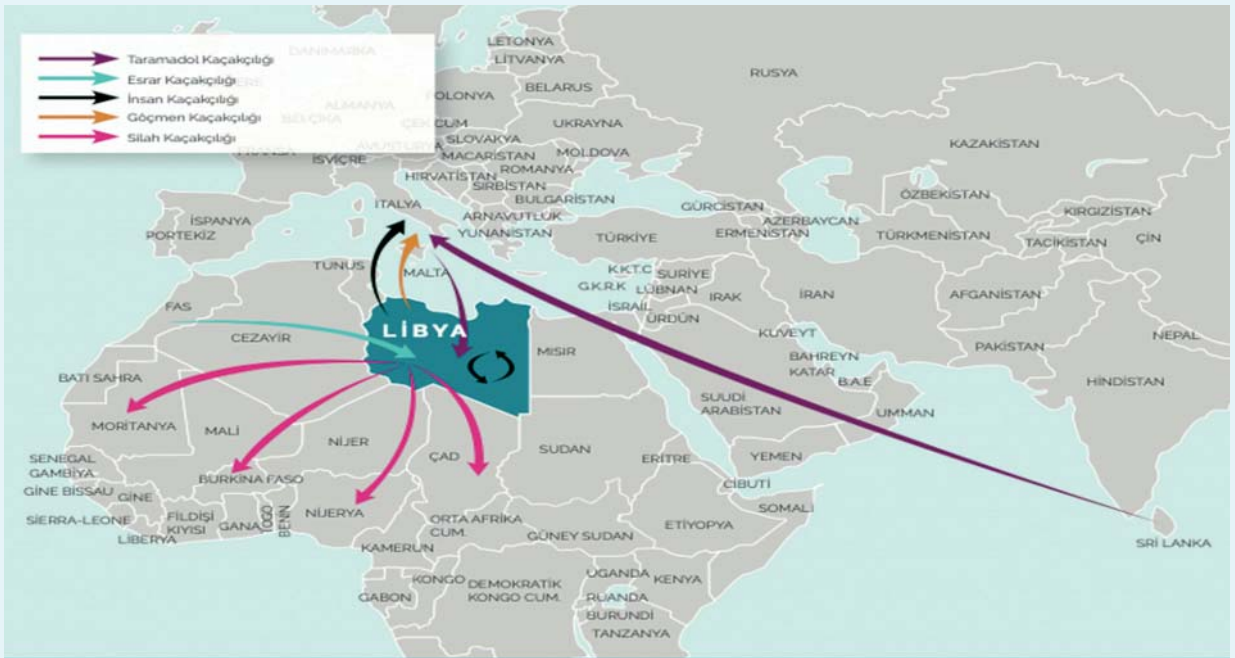
Görsel 2. Kaçakçılık Rotaları