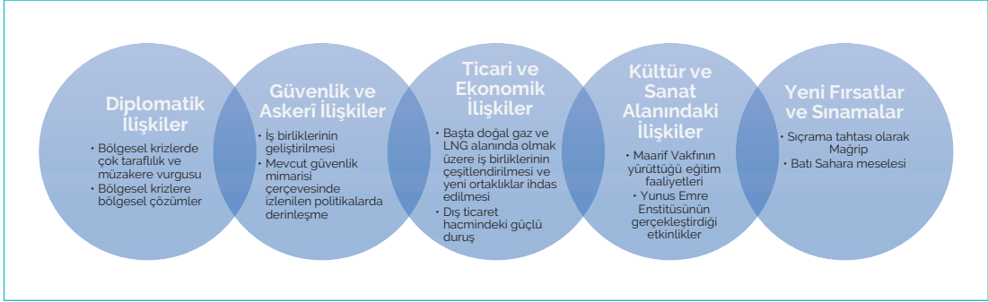
Grafik 1: 2024 Yılında Türkiye-Mağrip İlişkilerinin Boyutları