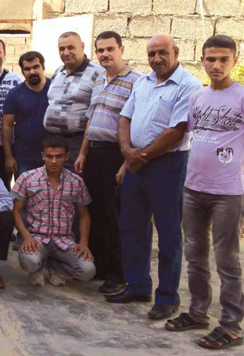
Selahaddin, Tuzhurmatu, Yengice 2012

Toplantıda Irak'ta yapılması planlanan nüfus sayımı ve Türkmenlerin durumu tartışılmış ve Irak Türkmenlerinin izlemesi gereken stratejiler ortaya konmaya çalışılmıştır.