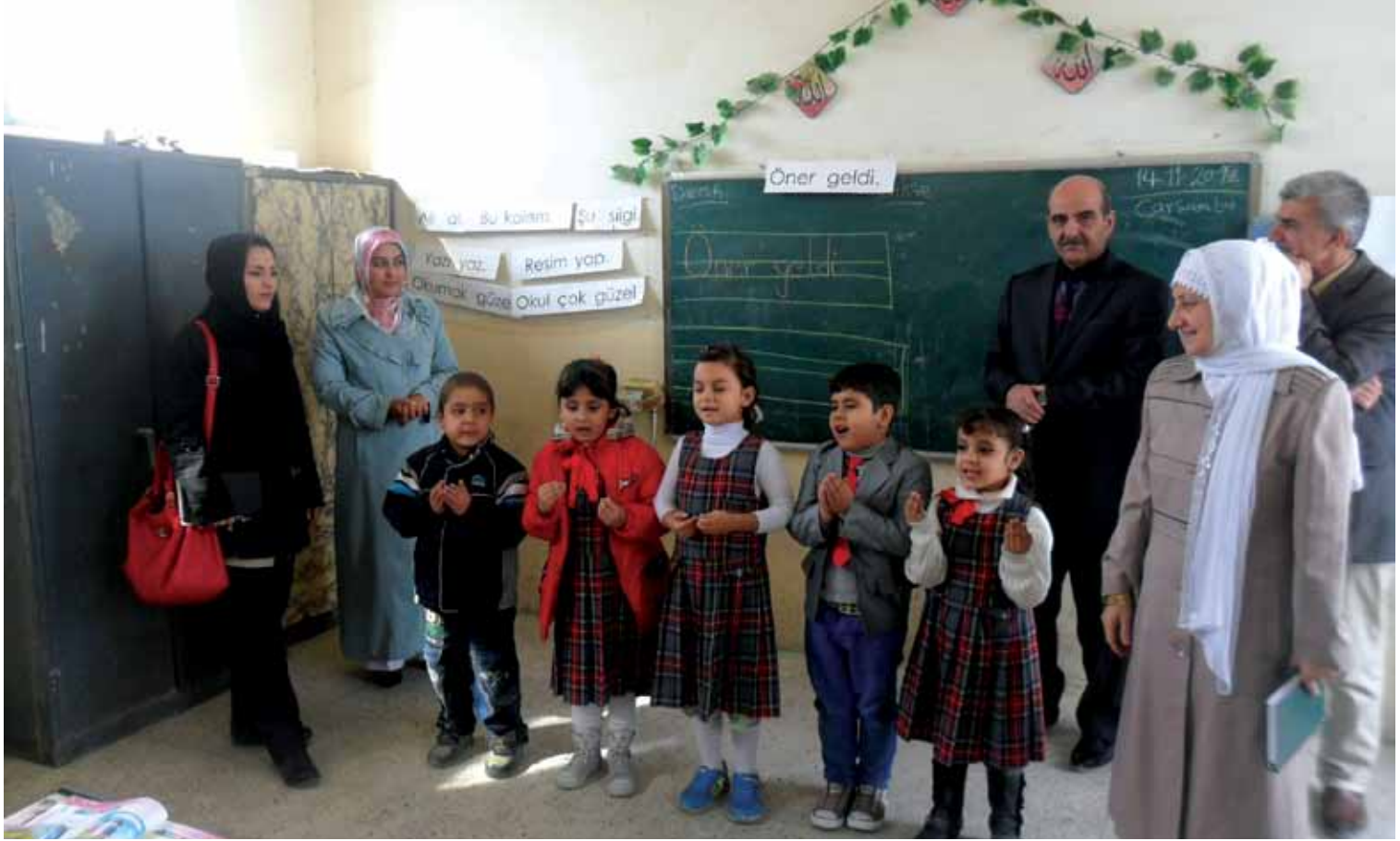
Kerkük, Kasım 2012

“Iraklı Bektaşiler Hacı Bektaş Şenliklerinde”, Hasan Kanbolat, 10 Ağustos 2010.