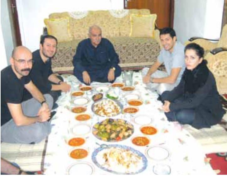
Kerkük, Kasım 2012