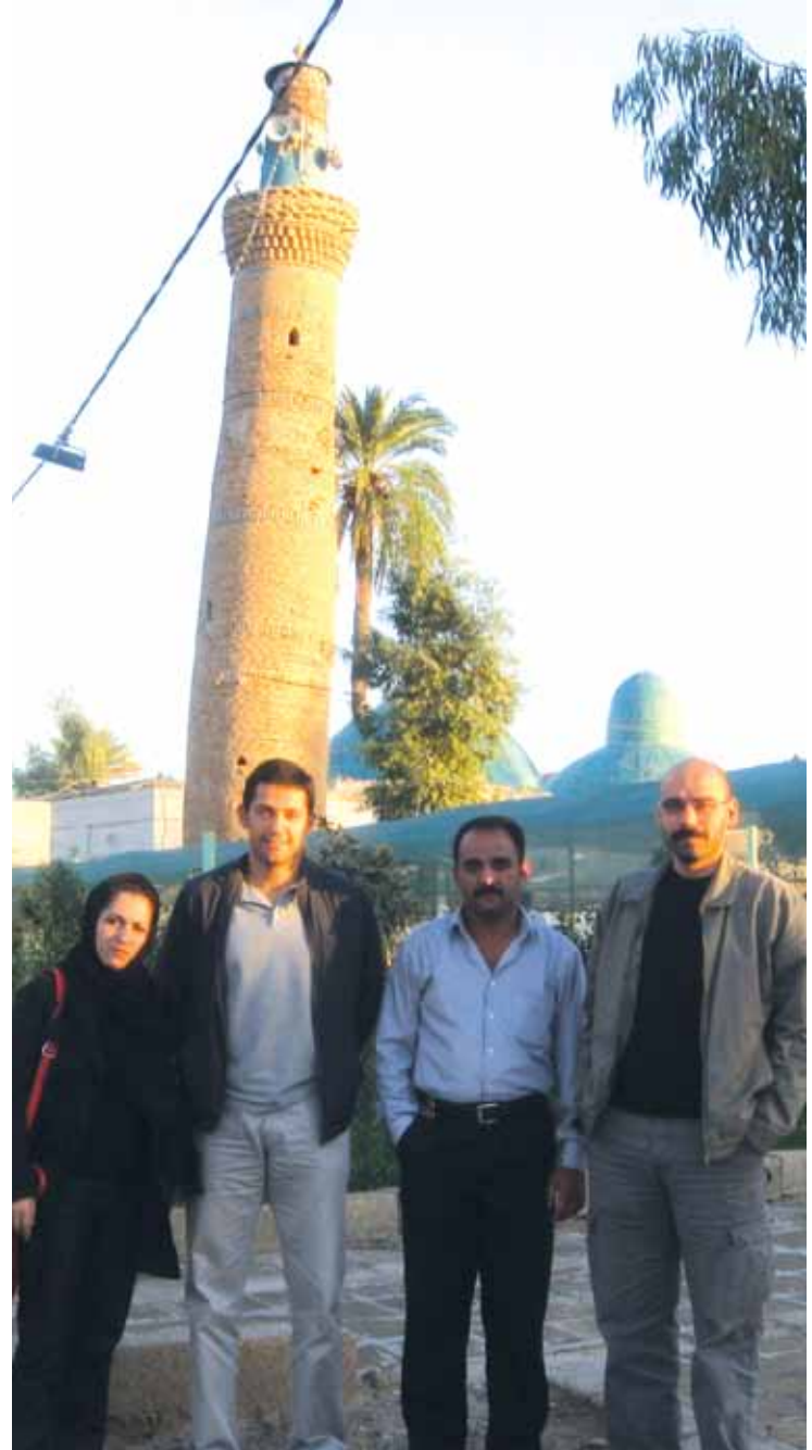
Kerkük, Kasım 2012