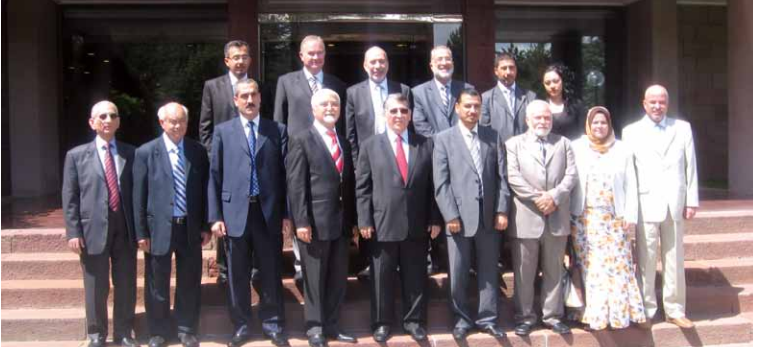
Irak heyeti ORSAM ziyareti, Cumhurbaşkanlığı, 2011

düzenlenmiştir. Toplantıda Iraklı mültecilerin durumu, Irak'taki siyasal dengeler, Türkiye'ye yönelik Irak Türkmenlerinin göçü ve Türkiye'deki Irak Türkmenleri varlığı üzerine sunum yapılmıştır