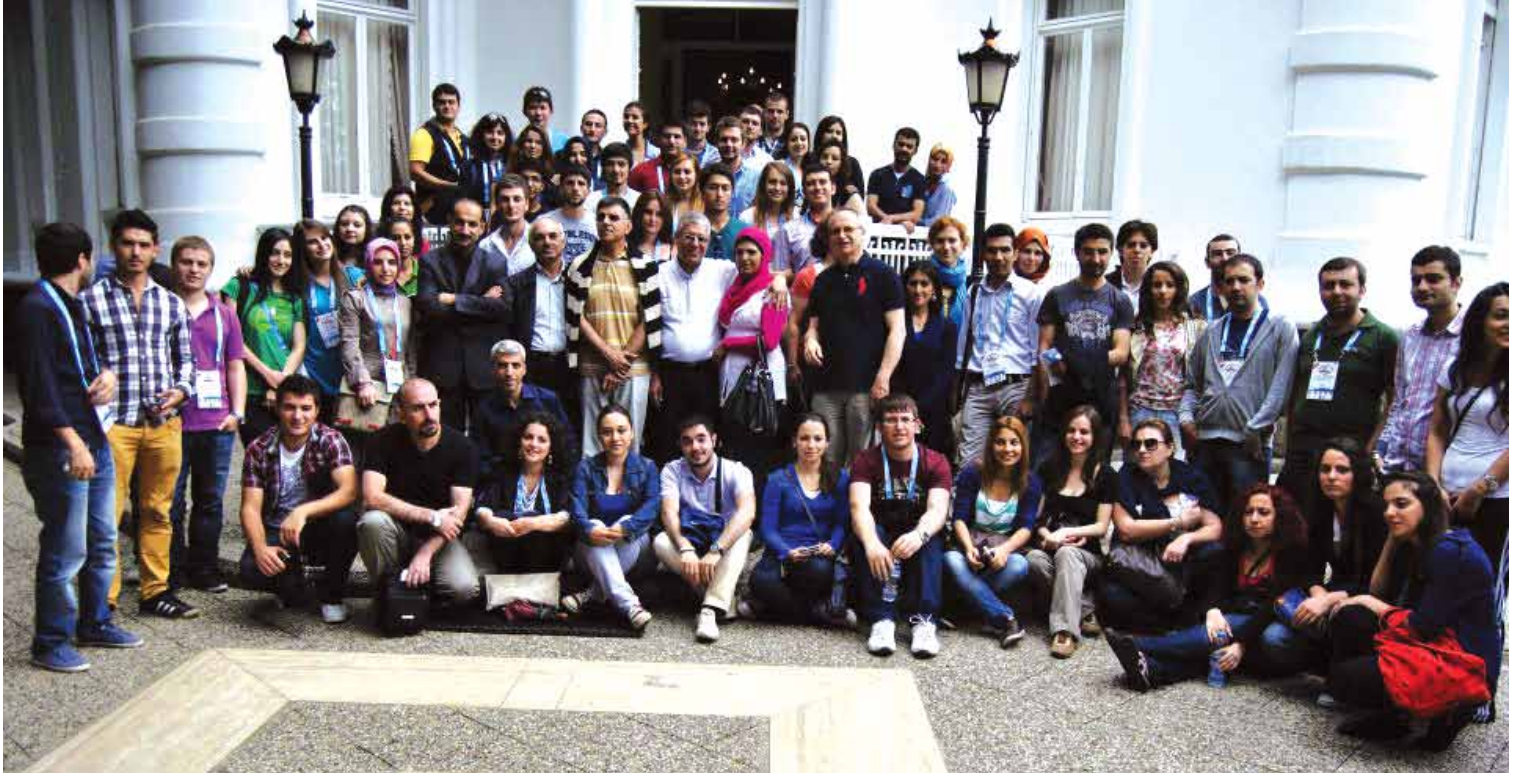
ORSAM Ortadoğu ve Avrasya Yaz Okulu, Trabzon, Temmuz 2012

lendirilmiştir. Aynı zamanda raporda Türkiye’de Iraklı göçmenlerle ilgili kuruluşların bilgilerine de yer verilmiştir.