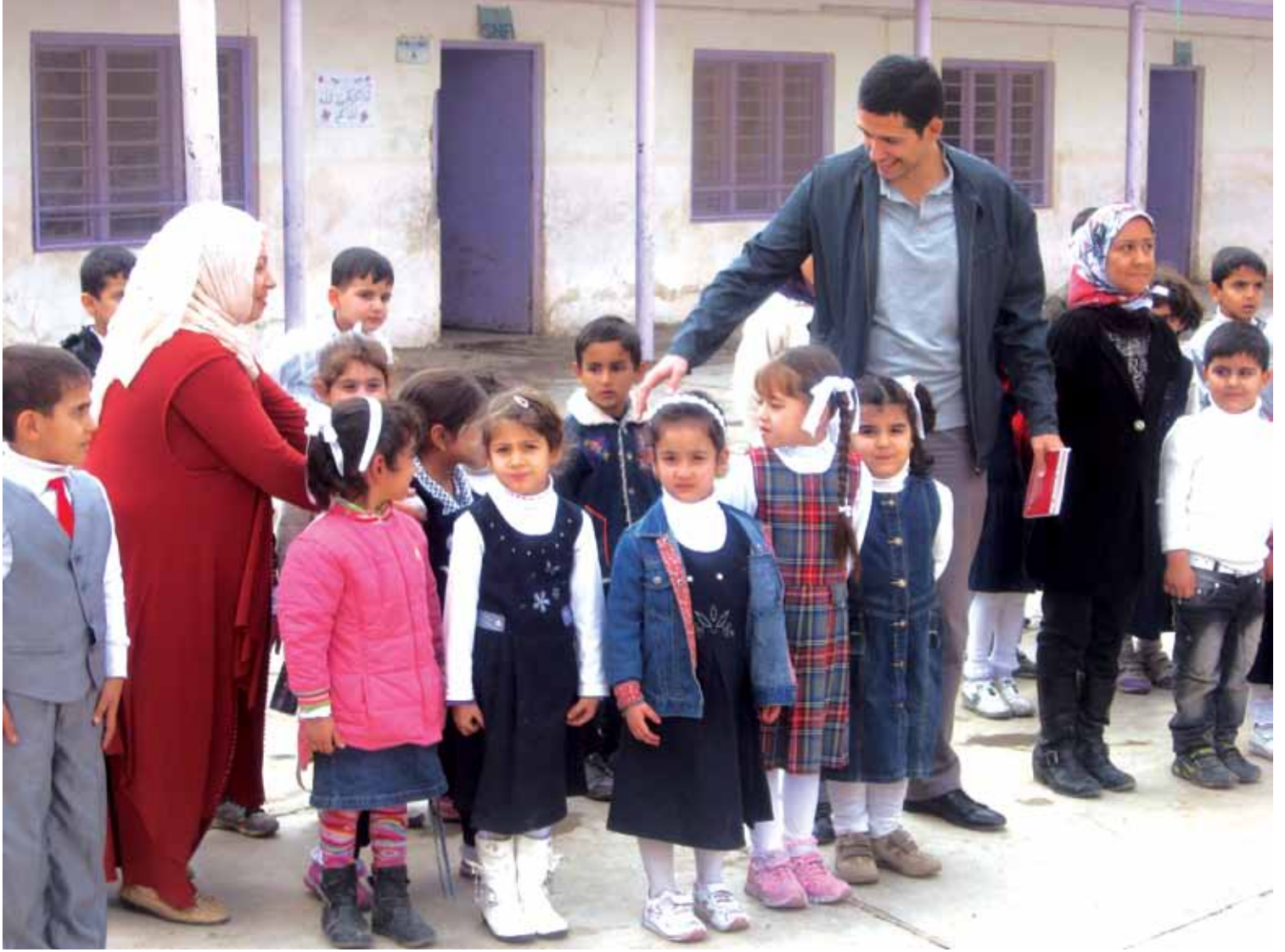
Kerkük, Kasım 2012