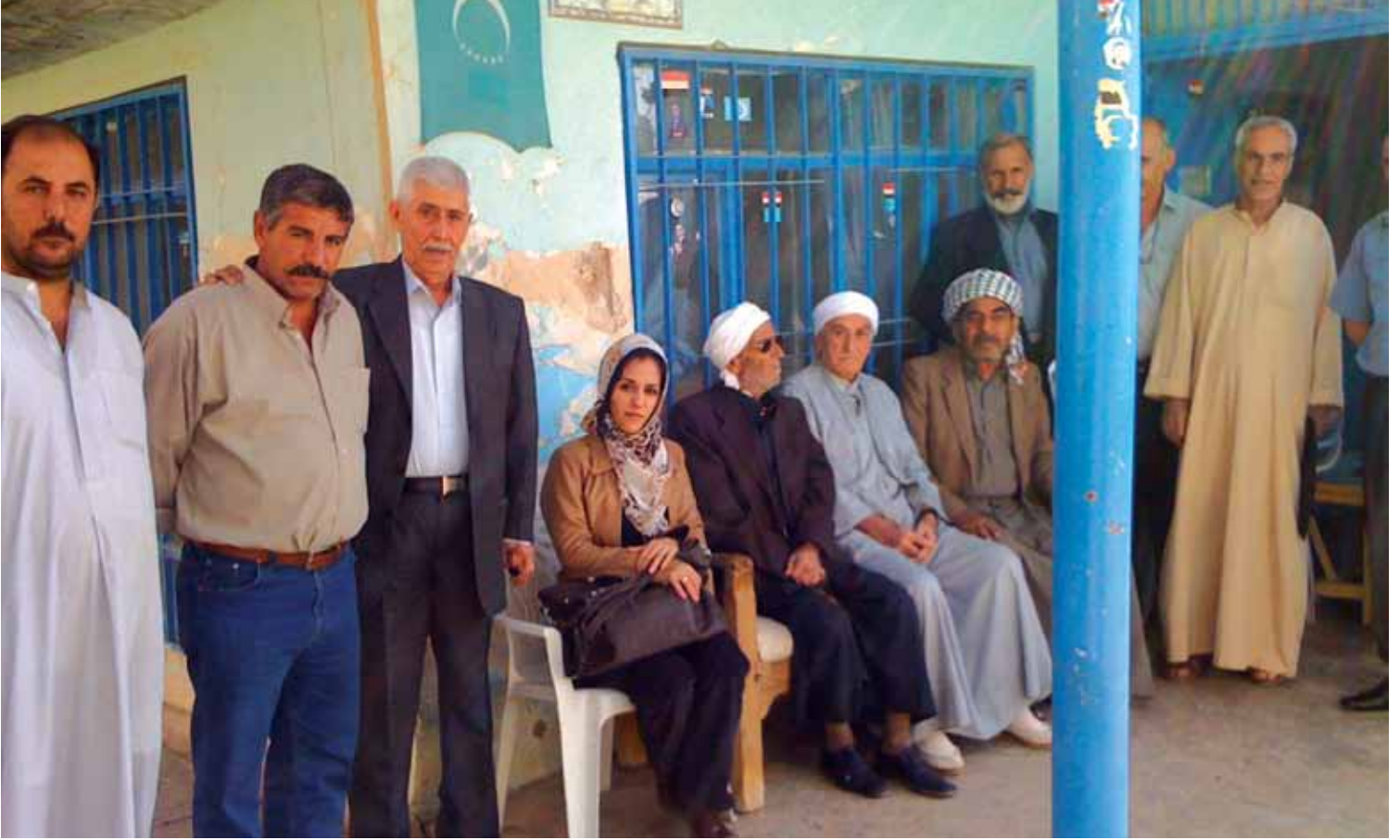
Kerkük, Kasım 2010

“ABD Güçlerinin 2004-2005 Telafer Operasyonları ve Bıraktığı İzler”, Bilgay Duman, Mayıs 2009.