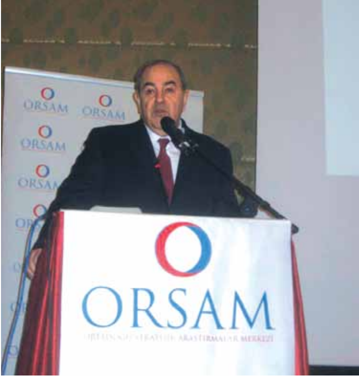
El Irakiye Listesi Lideri ve Irak Eski Başbakanı İyad Allavi, Ankara, Nisan 2010

ise Musul-Telafer-Kerkük-Tuzhurmatu-Bağdat'ta görüşmeler yürütmüştür.