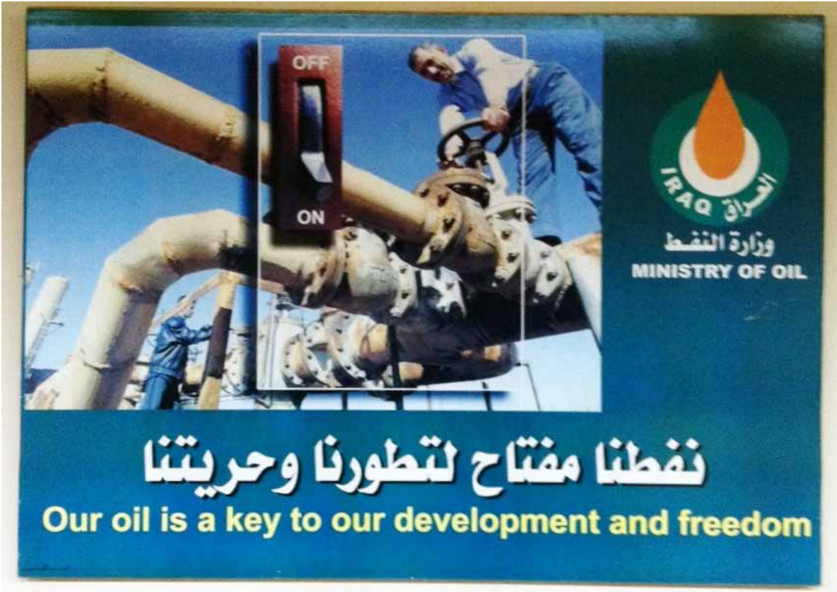
Irak Petrol Bakanlığı afişi

lesinin cereyan edeceği en önemli konulardan biri de petrol ve gaz kaynaklarının yönetimi ve bununla ilgili Federal Petrol Bakanlığınca hazırlanan ve 25 Ağustos 2011'de Bakanlar Konseyine sunulan Federal Petrol ve Gaz Yasası tasarısı ilgili olacaktır.