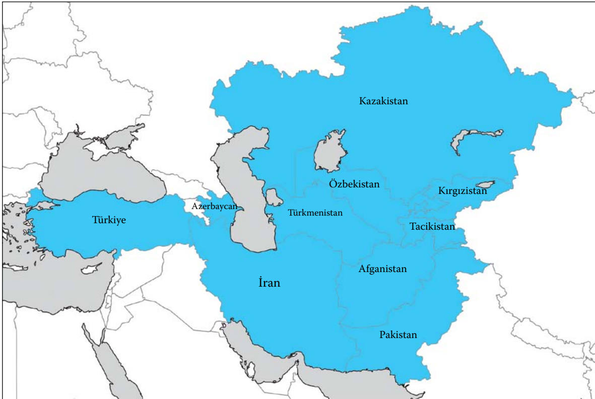
Ekonomik İşbirliği Teşkilatı Bölgesi

Üye ülkeler arasında çok yakın kültürel etkileşim ve benzerlikler vardır. Tarihsel bağlar ayrıca kayda değerdir. Dilbilimsel olarak farklılık gösterenlerde dahi binlerce ortak kelime vardır. Yaşayan Türk tarihçilerin duayeni Profesör Halil İnalcık'ın belirttiği gibi tarihsel araştırmalar, Türkiye, İran ve Pakistan ara-