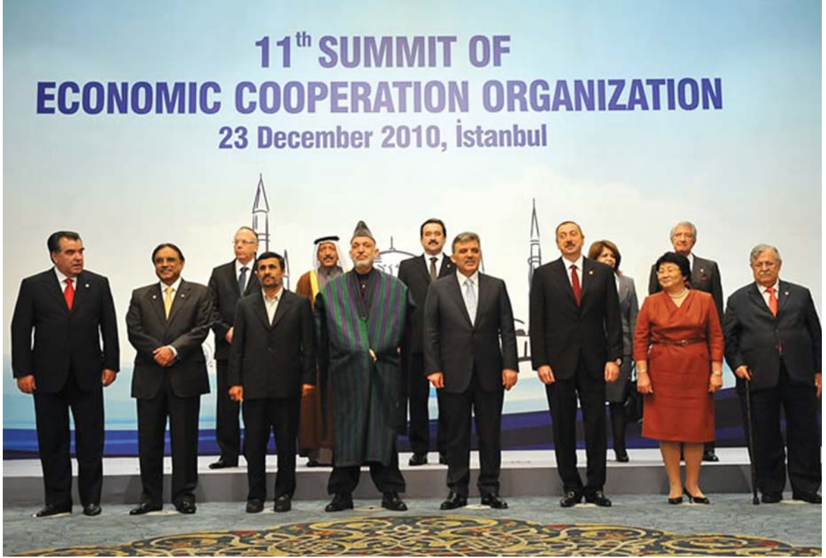
23 Aralık 2010'da İstanbul'da düzenlenen 11. EİT Zirve Toplantısı'nda Teşkilatın geleceğine ilişkin önemli kararlar alındı.

güçlendirilmesi gerekliliğinden bahsetmiştir. Üye devletler aynı zamanda EİT Daimi Temsilcilerine yardımcı olmak amacıyla Tahran'da ilgili hizmetlerde EİT konularında uzmanlaşmış görevli(ler) göndermeleri için de teşvik edilmektedirler.