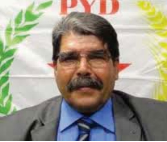
Salih Muslim Muhammed