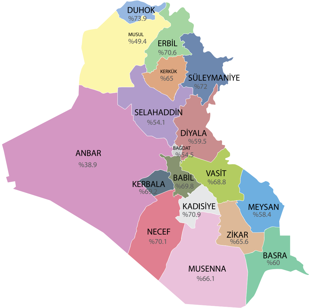
Grafik - 2 2014 Irak Genel Seçimleri İllere Göre Katılım Oranları

Genel seçimlerle birlikte Irak Kürt Bölgesel Yönetimi'nde (IKBY) de yerel seçimler gerçekleştirilmiştir. 19 Mayıs 2014 tarihi itibarıyla Irak genel seçimlerine ilişkin ilk resmi sonuçlar Irak