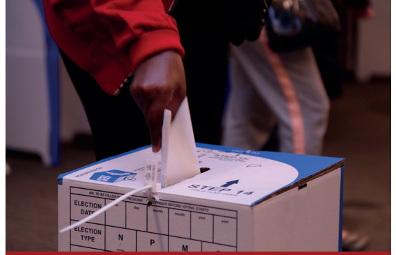
Bir seçmen 3 Ağustos 2016 tarihinde Johannesburg, Güney Afrika'daki Killarney Country Club'da yerel belediye seçimleri sırasında oy kullanıyor

"Apartheid", Afrikaans (Boer ya da Afrikanca) dilinde "ayrılık" anlamına gelmektedir. Güney Afrika'da "Apartheid" kavramı, Ulusal Parti (NP) hükümeti tarafından desteklenen bir ideoloji olmuş ve 1948 yılında Güney Afrika'da uygulanmaya başlanmıştır. Apartheid sistemi, her ırkın ayrı ayrı gelişmesini talep ediyordu 3 ki bu tavır seçimlere de yansımıştır. İngiliz Parlamentosu tarafından 1909 yılında kabul edilen Güney Afrika Yasası'nda kendi kendini yöneten İngiliz kolonileri Natal, Cape, Transvaal ve Orange Free State " Güney Afrika Birliği " altında birleştirilmiştir. 1961 yılına kadar birliğin anayasası olarak kalan yasa, Westminster mode-