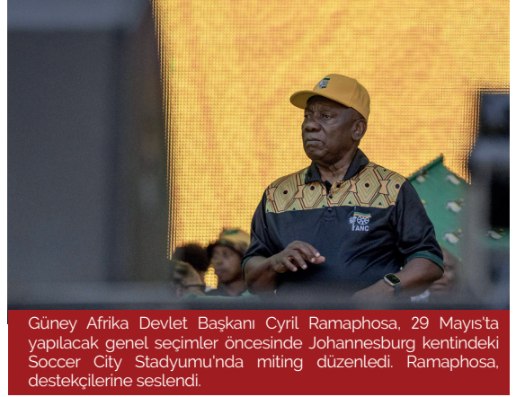
Güney Afrika Devlet Başkanı Cyril Ramaphosa, 29 Mayıs'ta yapılacak genel seçimler öncesinde Johannesburg kentindeki Soccer City Stadyumu'nda miting düzenledi. Ramaphosa, destekçilerine seslendi.

30 yıldır ANC yönetiminde olan Güney Afrika'da son seçimlerden sonra çok sayıda partinin yer aldığı bir koalisyon hükûmeti kurularak yeni bir sayfa açılmıştır. Uzun yıllardır devam eden GNU'da 11 siyasi partiden 7'sine bakanlık verilmiştir. Kabinetdeki görev dağılımlarının açıklanmasından sonra 32 bakanlıktan, 20'si ANC'de, 6 bakanlık DA'da kalırken kalan 6 bakanlık da diğer küçük partiler arasında paylaştırılmıştır. 34 Ülkedeki kilit bakanlıklar olarak görülen maliye, ticaret ve sanayi, dışişleri, savunma ve adalet bakanları ANC'den; tarım bakanı ve temel eğitim bakanı DA'dan; toprak reformu ve kırsal kalkınma bakanı Azanya Pan Afrikanist Kongresi'nden (PAC); kooperatif yönetim ve geleneksel işler bakanı ise IFP'den seçilmiştir. 35 Bu çok partili koalisyonda farklı siyasi partilerin farklı bakanlıkları aldıkları görülmektedir. Birden fazla partinin yer aldığı bir koalisyon hükûmeti beraberinde artılar ve etkileri de getirmektedir.