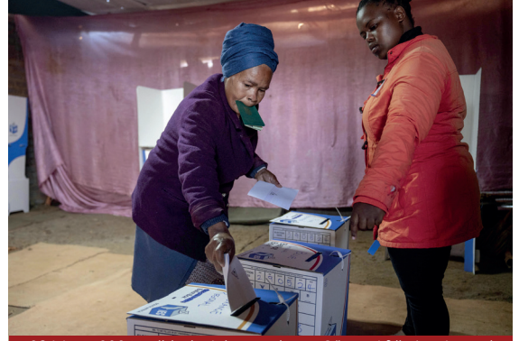
29 Mayıs 2024 tarihinde Johannesburg, Güney Afrika'nın Lenasia Bölgesi'nde yapılan Güney Afrika genel seçimleri sırasında seçmenler oylarını sandık başında kullandı.

Bu çalışma, Güney Afrika'nın Apartheid rejiminin sona ermesinden bu yana geçirdiđi demokratikleşme sürecini ve 2024 genel seçimlerinin ülkenin siyasi dinamikleri üzerindeki etkilerini kapsamlı bir şekilde mercek altına almıştır. Çalışmada, Apartheid sonrası uygulanan listeye dayalı nispi temsil sisteminin siyasi temsiliyeti ve adaleti ne ölçüde sağladığı, 2024 seçimlerinde Afrika Ulusal Kongresi'nin (ANC) çoğunluğu kaybetmesi ve koalisyon hükümetinin kurulmasının ülkenin siyasi dinamiklerini nasıl deđiştirdiđi gibi temel sorulara yanıt aranmıştır.