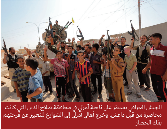
الجيش العراقي يسيطر على ناحية آمرلي في محافظة صلاح الدين التي كانت محاصرة من قبل داعش. وخرج أهالي آمرلي إلى الشوارع للتعبير عن فرحتهم بفك الحصار