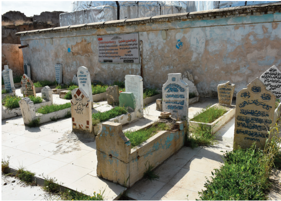
مقبرة الشهداء الأتراك في كركوك