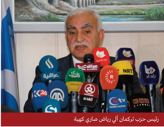
رئيس حزب تركمان آلي رياض صاري كهية