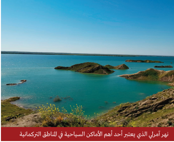
نهر آمرلي الذي يعتبر أحد أهم الأماكن السياحية في المناطق التركمانية