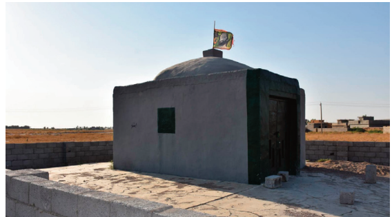
تكية مردان دده