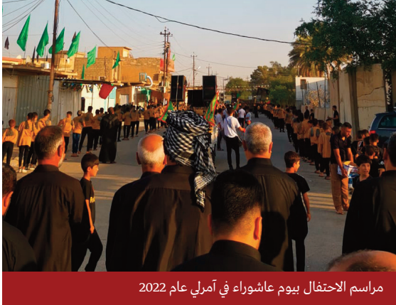
مراسم الاحتفال بيوم عاشوراء في آمرلي عام 2022