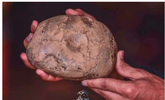
الحجر الذي رآته هارمه نينه إشارة في المنام

يقع مرقد هارمه نينه جنوب مقام الإمام الحسن. وفي الغالب يقوم أولئك الذين يزورون مقام الإمام الحسن بزيارة مرقد هارمه نينه. تقول الرواية إن هارمه نينه توفيت قبل أن تتزوج. وهناك روايات أن سبب عدم زواجها أنها رأت في المنام أن الامام الحسن يبلغها بأنها ستموت في سن مبكرة لو تزوجت.