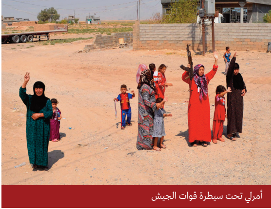
أمري تحت سيطرة قوات الجيش