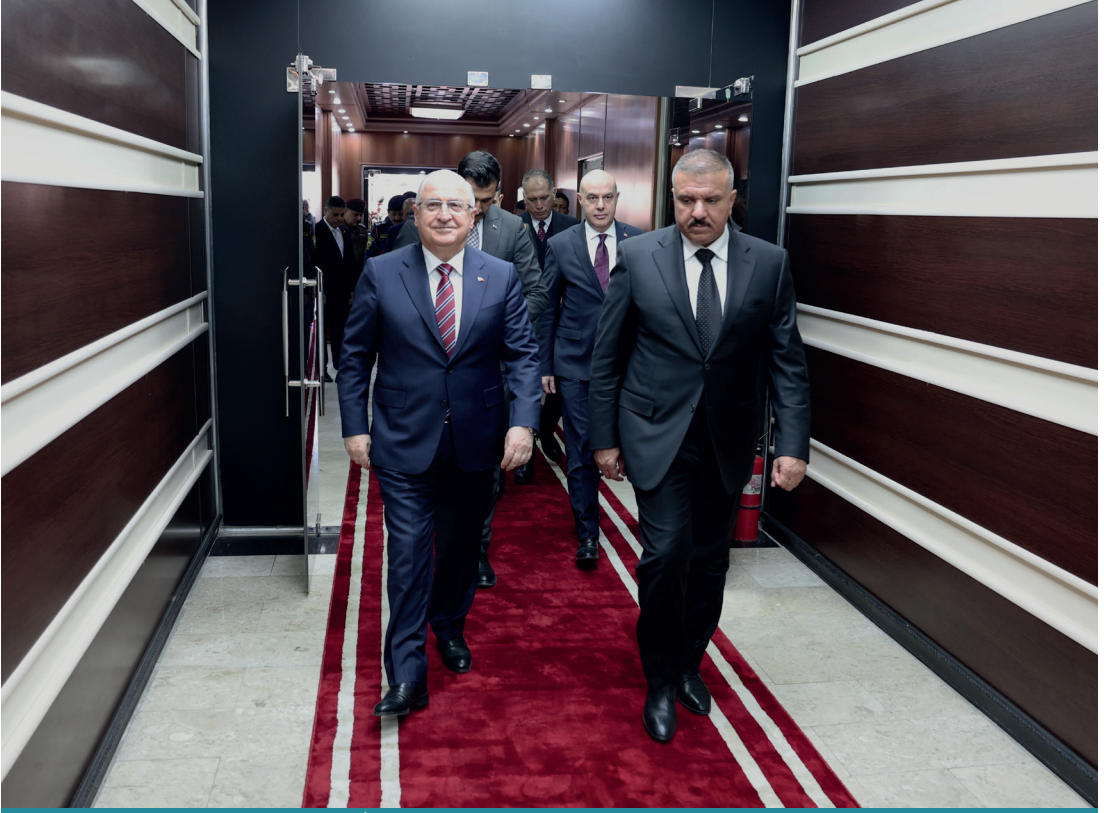
Milli Savunma Bakanı Yaşar Güler, Irak İçişleri Bakanı Abdülemir Kamil Şammari

sında sınır karakollarının inşa edilmesini içermektedir. Eş güdümlü olan bu iki aşamanın ilki için henüz bir sonuca varılamadığı belirtilirken Irak Kürt Bölgesel Yönetiminin (IKBY) kontrolündeki Duhok'ta yer alan Zaho'nun kuzeyinde ve Erbil'de 27'den fazla sınır karakolunun inşasına başlandığı vurgulanmaktadır. Ayrıca terör örgütü PKK'nın kontrol ettiği alanı azaltmak üzere çalıştıklarını belirten Sadi bu konuda İran ve Süleymaniye ile birlikte çalıştıklarını ifade etmiştir. 2