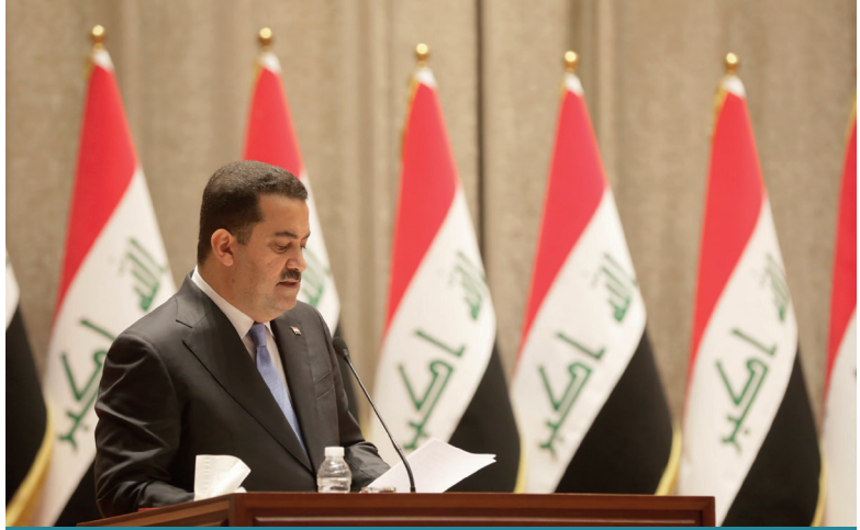
Muhammed Şiya es-Sudani liderliğindeki Irak hükümeti bölgesel ve uluslararası siyasette denge politikası izlemekte ve Irak'ın kronik sorunlarını çözmeye yönünde gelişmeler kaydetmektedir.

Iraklı yetkililer, Irak topraklarının komşu ülkelere karşı saldırı amacıyla kullanılmayacağını sürekli vurgulamaktadır ancak sınır güvenliğinin sağlanmasındaki sorunlar bu söylemlerin uygulanmasını engellemektedir.