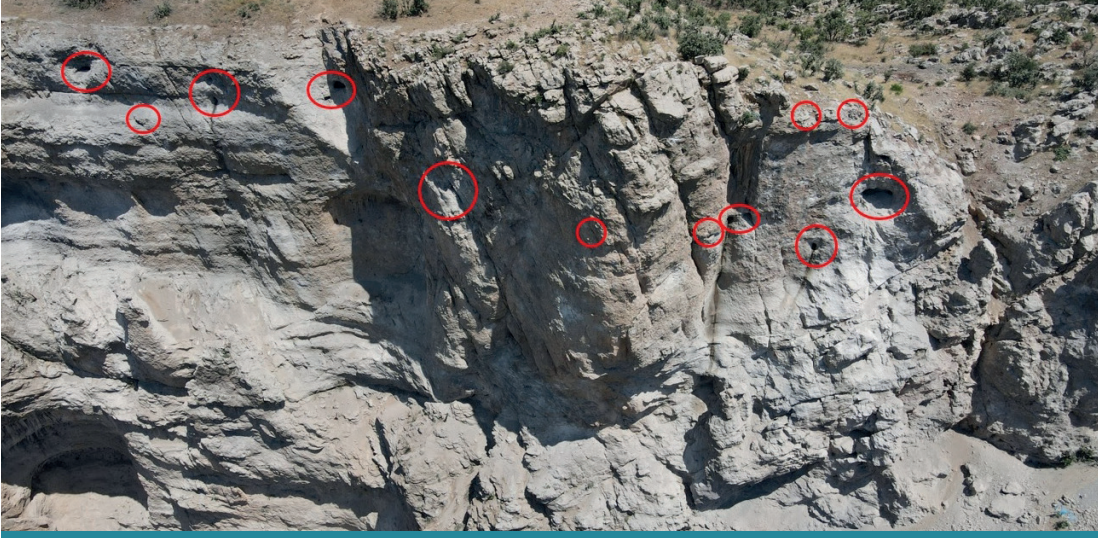
Türkiye'nin yaptığı operasyonlarda Irak ve Suriye'de keşfedilen terör sığınakları

linda hükümeti kuran Başbakan Sudani'nin görev süresinin dolmasına müteakip yapılacak seçimlerin ve kurulacak hükümetin bu yaklaşımları ne şekilde etkileyebileceği henüz kestirilememektedir. Bu nedenle sınır güvenliği konseptinin diğer muhatapları olan Türkiye ve İran'ın perspektifleri önem taşımaktadır.