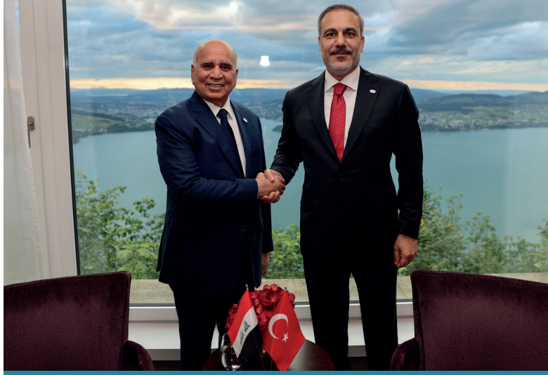
Dışışleri Bakanı Hakan Fidan ve Iraklı mevkidaşı Fuad Hüseyin

Sınırların bölgesel ilişkilerde fay hattı rolü üstlenmesi sebebiyle güvenliğe yapılacak yatırımların uzun vadede devletlerin egemenliğini öne çıkarabileceđi ve devlet dışı aktörlerin etkisini kırabilecek nitelikte olduđu düşünölmektedir.