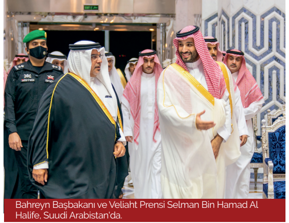
Bahreyn Başbakanı ve Veliht Prensi Selman Bin Hamad Al Halife, Suudi Arabistan'da.

Sputnik haber ajansı, kimlikleri açıklanmayan kaynaklardan alıntı yaparak Tahran ile Manama arasında ilişkileri yeniden başlatmak için önemli görüşmelerin sürdüğünü ancak "görüşmelerin şu anda ikili düzeyde olduğunu ve başka bir tarafın müdahil olmadığını" bildirdi. ISNA haber ajansının haberine göre Bahreyn Milletvekili Memduh Al-Saleh, Sputnik'e ayrıntı vermeden "Yakın gelecekte Tahran ile Manama arasındaki farklılıkları çözmek için girişimler önerilecek" dedi. İran'ın yerel haber ajansları, yerel kaynaklara dayanarak, İran ile Bahreyn arasında ilişkileri yeniden başlatmak için önemli görüşmelerin devam ettiğini bildirdi. İlişkilerin normalleşmesi için artık doğrudan ve başka bir tarafın arabuluculuğu olmaksızın ikili düzeyde müzakerelerin devam ettiği ve ihtilafı konularda anlaşma sağlanması hâlinde bu müzakerelerin sonuçlarının kısa süre sonra açıklanacağı söyleniyor. 30 Ayrıca, İran Dışişleri Bakanı Hüseyin Emir Abdullahiyan, Manama