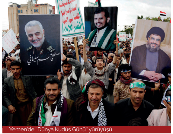
Yemen'de "Dünya Kudüs Günü" yürüyüşü

Yemen krizi, iki ülke arasındaki rekabetin en yıkıcı etkiye sahip olduğu ülke olması nedeniyle İran-Suudi Arabistan anlaşmasının en kritik sınavı olabilir. Ayrıca Yemen meselesi, Suudi Arabistan'ı İran ile normalleşme arayışına iten birincil önceliktir. Bu nedenle iki ülke arasında iki yıldan fazla süren normalleşme görüşmelerinin ilk gündem maddesinin Yemen krizi olduğu düşünülmüyordu. Dolayısıyla anlaşmanın en olumlu etkisinin bu alanda olması bekleniyor. İranlı yetkililer, Suudi Arabistan'la diplomatik ilişkilerin yeniden kurulmasının savaşın yıkıma uğrattığı Yemen'de ateşkese ulaşma çabalarını hızlandıracağını belirtti. İran'ın Birleşmiş Milletler Daimî Temsilciliği, Yemen halkı üzerindeki kuşatmanın sona erdirilmesi, ateşkesin sağlanması ve Yemen'de kapsayıcı bir ulusal hükümetin kurulmasının Riyad ve Tahran arasındaki diplomatik ilişkilerin kurulmasıyla kolaylaşacağını iddia etti. Tasnim Haber Ajansına göre BM Yemen Özel Temsilcisi Hans Grundberg, Yemen krizindeki son gelişmeleri görüşmek üzere Tahran'ı ziyaret ederek İran Dışişleri