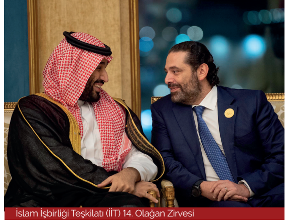
İslam İşbirliği Teşkilatı (İİT) 14. Olağan Zirvesi

Tahran ve Riyad arasındaki gerilimin azalması, mali çöküşle karşı karşıya olan Lübnan'da siyasi bir uzlaşma için kolaylaştırıcı olabilir. Suudi Arabistan, bir zamanlar Lübnan'ın en yakın Arap müttefik ve hayırseveri olsa da İran destekli Hizbullah'ın ülkedeki nüfuzu nedeniyle ilişkileri büyük ölçüde bozulmuştur. 2021 yılında, dönemin Lübnan enformasyon bakanının Suudi Arabistan öncülüğündeki koalisyonun Yemen'deki savaşını eleştirmesi nedeniyle Suudi Arabistan ve bazı Körfez Arap müttefikleri Beyrut'taki büyükelçilerini geri çekti. Elçiler daha sonra geri döndü ancak Suudi-Lübnan ilişkileri hâlâ soğuk. Hem Hizbullah hem de Lübnan'ın geçici Başbakanı Necip Mikati Suudi-İran anlaşmasını överken, Mikati bunu "bölgede nefes almak ve geleceğe bakmak için bir fırsat" olarak nitelendirdi ancak analistler bu anlaşmanın Lübnan'ın Riyad ile ilişkilerinin otomatik olarak düzeleceği anlamına gelmediğini söylüyor. Al Arabiya'nın haberine göre, Suudi Dışişleri Bakanı Prens