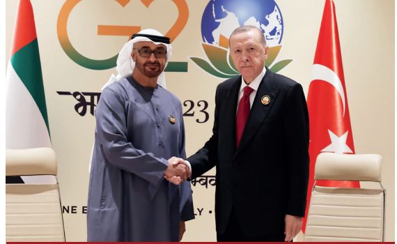
Cumhurbaşkanı Erdoğan'ın Eylül 2023'te Hindistan'da düzenlenen G20 Zirvesi'nin oturum aralarında Birleşik Arap Emirlikleri Devlet Başkanı Şeyh Muhammed bin Zayed ile görüşmesi.

BAE'nin Kalkınma Yolu Projesi'nin iş birliği ve mutabakat zaptının imzalanmasına katılımının açıklanmasının ardından bir soru gündeme gelmiştir: IMEC koridoru projesinde kilit bir ortak olan BAE, Kalkınma Yolu Projesi'ne nasıl katılacak? Zira birçok kişi iki projenin bir-biri ile rekabet eden belki de birinin diğerini açığa düşüren projeler olduğu kanaatinindedir.