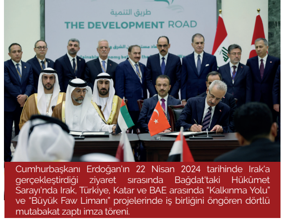
Cumhurbaşkanı Erdoğan'ın 22 Nisan 2024 tarihinde Irak'a gerçekleştirdiği ziyaret sırasında Bağdat'taki Hükümet Sarayı'nda Irak, Türkiye, Katar ve BAE arasında "Kalkınma Yolu" ve "Büyük Faw Limanı" projelerinde iş birliğini öngören dörtlü mutabakat zaptı imza töreni.

Irak hükümeti Kalkınma Yolu projesini başlattığında 17 milyar dolarlık bir ön maliyet hesabı yapmış ve üç finansman seçeneği sunmuştu. İlk seçenek Irak hükümetinin projeyi sadece genel bütçesinden finanse etmesi olmakla birlikte gözlemciler Irak genel bütçesindeki mevcut açık göz önünde tutulduğunda Irak hükümetinin bunun için imkânının olmadığını değerlendirmektedir.