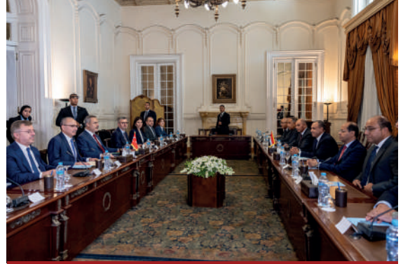
Dışışleri Bakanı Hakan Fidan Kahire'de Mısır Dışışleri, Gc ve Yurtdış Mısırlular Bakanı Bedr Abdulati ile heyetler arası grüşme gerekleřtirdi.