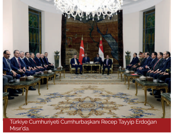
Türkiye Cumhuriyeti Cumhurbaşkanı Recep Tayyip Erdoğan Mısır'da.

Türkiye-Mısır ilişkilerinde strateji ve güvenlik boyutu, her iki ülkenin de Ortadođu, Dođu Akdeniz ve Afrika'daki jeopolitik dengeleri etkileme potansiyeli taşıdığı bir çerçevede önemli bir yer tutmaktadır. Türkiye ve Mısır bölgesel güvenlik konularında farklı yaklaşımlar benimsese de ortak tehditler ve çıkarlar doğrultusunda iş birliği yapma kapasitesine sahiptir. Türkiye'nin Dođu Akdeniz'deki enerji kaynakları ve deniz yetki alanları üzerindeki haklarını koruma çabalarının yanı sıra Libya krizi ve terörle mücadele gibi konularda da her iki ülkenin bölgedeki güvenlik ve istikrar arayışlarıyla kesişmektedir. Bu bağlamda, Türkiye ve Mısır arasındaki ilişkilerin güvenlik ve strateji boyutu, bölgesel rekabetin yanı sıra iş birliği ve ortaklık fırsatlarını da barındıran dinamik bir yapı arz etmektedir.