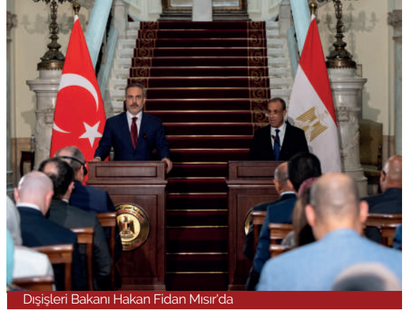
Dışışleri Bakanı Hakan Fidan Mısır'da

Günümüz Türkiye-Mısır ilişkileri, son yıllarda yaşanan diplomatik açılımlar, bölgesel politikalar ve uluslararası kuruluşlardaki iş birliği çerçevesinde yeniden şekillenmektedir. Arap halk hareketleri sonrası dönemde yaşanan gerginliklerin ardından, her iki ülke de diplomatik ilişkileri yeniden canlandırma ve iş birliği fırsatlarını değerlendirme yoluna gitmiştir. Bu süreçte diplomatik normalleşme, bölgesel iş birliği alanları ve çok taraflı diplomasi çabaları öne çıkmaktadır. Nitekim Türkiye ve Mısır arasındaki diplomatik açılımlar ve diyalog kanalları, 2021 yılında başlayan ve iki ülke arasındaki uzun süreli diplomatik soğukluğu sona erdirmeye yönelik atılan adımlarla şekillenmiştir. Bu süreç, 2013'teki Mısır askerî darbesi sonrası kesilen diplomatik temasların yeniden başlaması ve karşılıklı güven inşasına yönelik önemli bir dönüm noktası olarak kabul edilmektedir. Türkiye ve Mısır arasındaki ilişkilerin normalleşme süreci, her iki ülkenin de stratejik çıkarlarının farkına varması ve bölge-