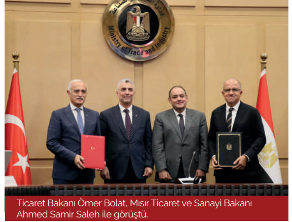
Ticaret Bakanı Ömer Bolat, Mısır Ticaret ve Sanayi Bakanı Ahmed Samir Saleh ile görüştü.

Türkiye ve Mısır arasındaki ekonomik ve ticari ilişkiler, tarihsel bağların ötesinde, son yıllarda hızla artan ticaret hacmi ve karşılıklı yatırımlar ile dikkat çekici bir ivme kazanmıştır. İki ülkenin ekonomik ve ticari ortaklıkları, yalnızca bölgesel düzeyde stratejik konumlarını güçlendirmekle kalmamış aynı zamanda küresel ekonomik arenada da rekabet güçlerini artırmıştır. Türkiye ve Mısır arasındaki ticaretin gelişimi, her iki ülkenin de ekonomik büyümesini ve istihdamını destekleyen çeşitli sektörlerde derinleşen iş birlikleriyle kendini göstermektedir. Bu bağlamda karşılıklı ekonomik bağımlılığın artması, iki ülkenin bölgesel ekonomi ve ticarete önemli ortaklar hâline gelmesine katkıda bulunmuştur. İlerleyen dönemlerde enerji, altyapı, turizm ve hizmet sektörlerinde ortaya çıkabilecek yeni iş birliği fırsatları, Türkiye ve Mısır arasındaki ekonomik ilişkilerin daha da derinleşmesine ve sürdürülebilir bir kalkınma modelinin geliştirilmesine olanak tanıyacaktır.