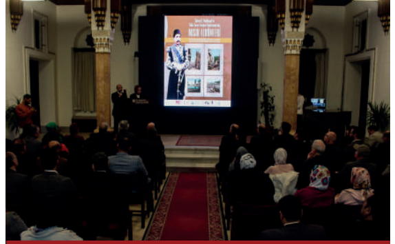
Kahire Yunus Emre Enstitüsü (Kahire YEE), Türkiye Cumhuriyeti'nin 100. yılı dolayısıyla "Sultan II. Abdülhamid'in Yıldız Sarayı Fotoğraf Koleksiyonunda Mısır Albümleri" konulu konferans ve sergi düzenledi.

Türkiye ve Mısır arasındaki tarihsel ilişkiler, Yavuz Sultan Selim döneminde Osmanlı Devleti'nin Mısır'ı fethetmesiyle başlayıp Cumhuriyet Dönemi'ne kadar uzanan, zengin ve çok katmanlı bir geçmişe sahiptir. Günümüzde iki ülke arasındaki ilişkiler, Osmanlı mirasının getirdiği ortak sosyo-kültürel değerlerin olumlu etkileri ve Cumhuriyet Dönemi'ndeki siyasi ve diplomatik gelişmeler bağlamında değerlendirilmektedir. 1 Bu ilişkilerin tarihsel kökenlerini ve değişen dinamiklerini anlamak, Türkiye ve Mısır'ın bugün birbirleriyle nasıl etkileşimde bulunduğunu daha iyi kavrayabilmek için önemlidir. Hem Osmanlı Dönemi hem de Cumhuriyet Dönemi'nde yaşanan gelişmeler, bu etkileşimin temelini oluşturan faktörleri ve iki ülke arasındaki iş birliğinin şekillenmesini derinlemesine incelenmesini gerektirmektedir.