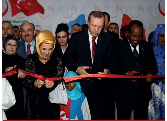
Türkiye Cumhuriyeti Cumhurbaşkanı Erdoğan Somali'de

Somali'yle ilişkiler, Türkiye'nin Afrika politikasında merkezi konumdadır. İki ülke arası ilişkilerde özellikle Cumhurbaşkanı Erdoğan'ın başbakanlığı döneminde 2011 yılındaki Mogadişu ziyareti temel bir dönüm noktasıdır. Erdoğan'ın ziyaretinden Çerçeve Anlaşması'na kadar geçen süreçte ise Türkiye'nin Somali'ye yönelik dış politikasında, 2012 yılında ekonomik ve diplomatik ilişkiler; 2017 yılında askerî ve güvenlik iş birlikleri; 2018 yılından itibaren ise sürdürülebilir kalkınma ve eğitim alanlarındaki ilişkiler gelişmiştir. Dolayısıyla iki ülke arası ilişkilerin gelişimindeki 2011-2024 arası süreçte çeşitli alanlarda üç temel dönüm noktası kaydedilmiştir.