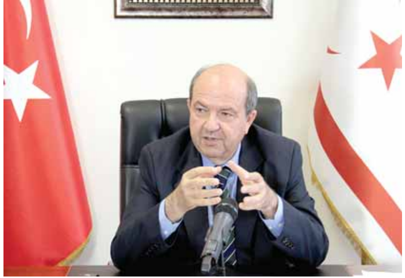
Kuzey Kıbrıs Türk Cumhuriyeti (KKTC) Başbakanı Ersin Tatar

haklara sahip olan KKTC olduğunu vurgulamıştır. Türkiye ayrıca AB'nin böyle etkisiz, gerçeklikten kopuk ve yapıcı olmayan yaptırım kararı almak yerine adadaki iki tarafı hidrokarbon kaynakları konusunda müzakere masasına oturmaya teşvik etmesinin daha rasyonel bir seçim olacağına dikkat çekmiştir.