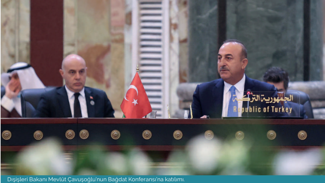
Dışişleri Bakanı Mevlüt Çavuşoğlu'nun Bağdat Konferansı'na katılımı.

bin Raşid Al Maktum, Suudi Arabistan'ın Dışişleri Bakanı Faysal bin Ferhan el-Suud ve İran'ın Dışişleri Bakanı Hüseyin Emir Abdullahiyan da katılmıştır. Siyasi, ekonomik, toplumsal ve güvenlikle ilgili alanlarda istikrarı sağlamada sorun yaşayan Irak'ın, ABD'nin Irak'tan muharip askerlerini tamamen çekme kararı sonrasında yüksek seviyeli katılımın yaşandığı ve pek çok konuda sorun yaşayan ülkeleri bir araya getiren böyle bir konferansı düzenlemiş olması, 10 Ekim 2021'de yapılması planlanan Irak Parlamentosu seçimleri öncesinde Irak'ın ülkesel özgüveni, istikrarı ve bölgesel ve küresel politikadaki prestijinin ve konumunun yeniden inşası açısından büyük önem taşıdığını söylemek yanlış olmayacaktır.