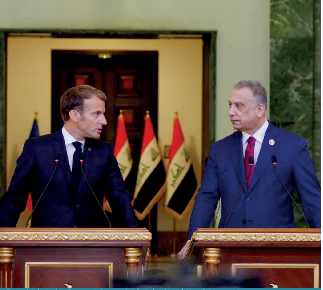
Fransa Cumhurbaşkanı Emmanuel Macron ve Irak Bařbakanı Mustafa Kazimi'nin basın toplantısı.