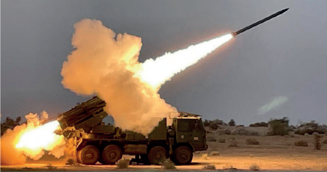
Hindistan-PINAKA test atışları

satışı anlaşmasının duyurulmasının ardından Hindistan Dışişleri Bakanı Subrahmanyam Jaishankar'ın ekim ayındaki Ermenistan ziyaretinde "gelecekteki iş birliği ve farklı düzeylerde karşılıklı ziyaretler için bir yol haritası" kararı alınmıştır. 10 Savunma alanındaki gelişmelerin yanı sıra ikili ticari ve ekonomik iş birliğinin artırılması amacıyla Yeni Delhi'nin Hintli girişimcileri "olasılıklar ve potansiyeller çok büyük olduğu için Ermenistan'a yatırım yapmaya" teşvik ettiği öğrenilmiştir. 11