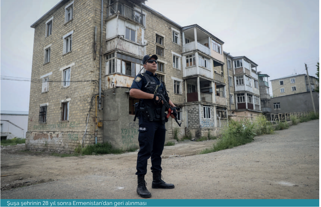
Suşa şehrinin 28 yıl sonra Ermenistan'dan geri alınması

gesindeki olası yansımalarıyla da dikkate değer bulunmaktadır. Bu kapsamda Hindistan ve Ermenistan arasındaki iş birliği seyrinin iyi takip edilmesi gerektiği değerlendirilmektedir. Bu çalışmada öncelikle Hindistan ve Ermenistan arasındaki askerî ve savunma alanlarındaki iş birliğinin arka planı verilecektir. Ardından iş birliğinin geliştirilmesinde rol oynayan temel motivasyonlar, bağlantılı aktörlerin bakış açılarıyla ele alınacaktır. Son olarak Hindistan'ın bölgeye nüfuzunun anlaşılması açısından söz konusu iş birliğinin her iki taraf için olası sonuçları, mevcut sınırlılıklar ve bölgesel yansımaları bağlamında Güney Kafkasya ve Ortadoğu'ya etkileri tartışılacaktır.