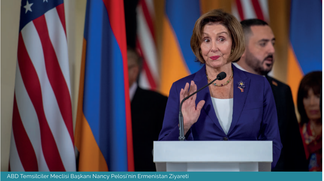
ABD Temsilciler Meclisi Başkanı Nancy Pelosi'nin Ermenistan Ziyareti

yılından itibaren ivme kazanmaya başladığı anlaşılmaktadır. 2020 yılında varılan anlaşma kapsamında Hindistan'ın, Ermenistan'a toplamda 40 milyon dolar değerinde 4 adet Swathi radarı tedarik etmesi kararlaştırılmıştır. 4 Bu tarihten itibaren, Nikol Paşinyan liderliğindeki Ermeni hükümeti, özellikle Pinaka uzun menzilli füze sistemleri, ATGM tanksavar güdümlü füzeleri ve Akash uçaksavar füze sistemlerine büyük ilgi göstermeye başlamıştır. 5 Haziran 2022'de, Azerbaycan-Ermenistan arasında sınır hattında artan gerginlikler üzerine, Ermenistan'dan üst düzey bir savunma heyeti, insansız hava araçları da (İHA) dâhil olmak üzere silah satın alımı için Yeni Delhi ile müzakere etmek amacıyla Hindistan'ı ziyaret etmiştir. 6 Temmuz 2022'de