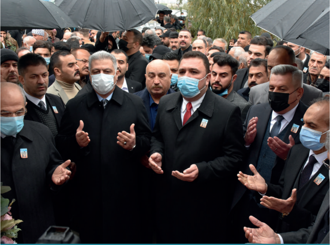
Irak'ta Baas rejimince şehit edilen Türkmen liderler törenle anıldı.

BY'de düzenlenen referandumun ardından Irak merkezî hükûmetine bölgede en büyük desteğin Türkmen toplumundan geldiğini söylemek yanlış olmayacaktır. Türkmenler hem askerî operasyona katkı sağlamış hem Irak federal güçlerinin Kerkük gibi önemli bir şehre girmesi için şehir merkezinde destek gösterileri gerçekleştirmiştir.