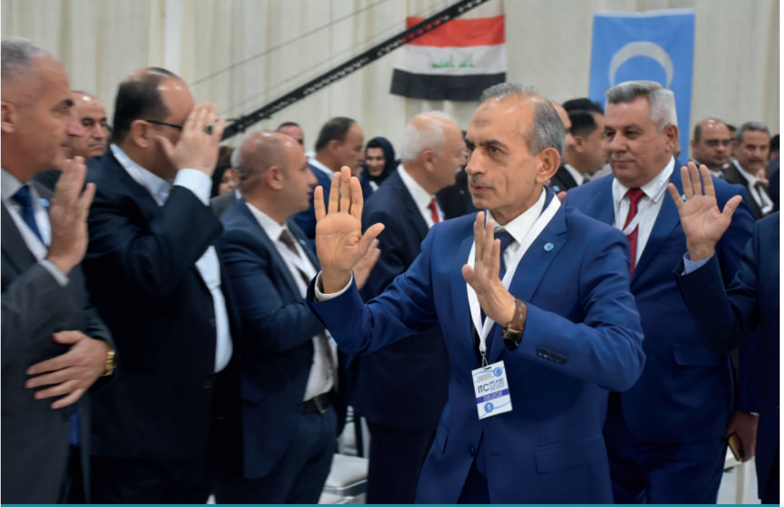
Irak Türkmen Cephesi Başkanlığına yeniden Hasan Turan seçildi.

temine geçişin gerekçesinin Irak'ta mevcut siyasi partilere uyum sağlamak olduğu söylenmektedir. Kurultay da ayrıca mevcut tüzüğün bazı maddelerinde değişikliklerin yapıldığı açıklanmıştır. Yapılan değişikliklerden bir diğeri de ITC'ye bağlı parti içi bir meclisin kurulmasıdır. Kurulacak meclis, Türkmeneli bölgelerinden seçilecek 51 üyeden oluşacaktır. Hasan Turan kurultayda, yönetim kuruluna Türkmeneli'nin neredeyse bütün yörelerinde üye almıştır. Kabinede gençlerin yanı sıra kadın üyenin de bulunması önem arz etmektedir.