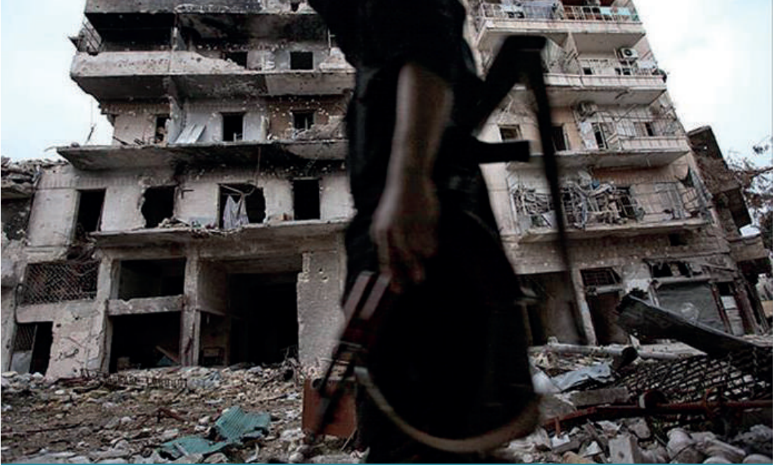
Rejim yanlısı milis güçleri çok sayıda savaş suçunun faili durumunda.