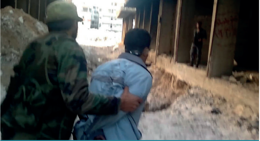
2013'te Şam'ın Tadamun bölgesinde Esad rejimi ordusu ve USG milisleri tarafından 41 sivilin infazına dair görüntüler 2022'de ortaya çıkmıştır.

USG'nin kuruluşunda İran'ın baskıya varan yönlendirmeleri, Tahran'ın Suriye'deki nüfuzunu tıpkı Irak'ta yaptığı gibi milisler üzerinden arttırma amacıyla olduğu şeklinde yorumlanmıştır. 6 Bununla birlikte İran'ın toplumsal olaylara müdahale ve sivil istihbarat aparatı olarak kullandığı Besic milisleri tecrübesinin de Suriye'de ayaklanmanın patlak vermesi sonrasında Tahran'ın Suriye için acil müdahale senaryolarına yön vermiş olması muhtemeldir.