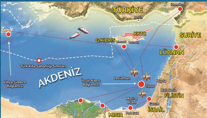
Tablo 3. East-Med Boru Hattı Projesi

Leviathan sahasından çıkacak enerjinin de Kıbrıs üzerinden Mersin'e gitmesi tasarlanmıştı. Bölgede yaşanan son gelişmelerle oluşan yeni denklemler neticesinde; 7 milyar dolar gibi büyük bir maliyete sahip, İsrail, GKRY, Yunanistan ve İtalya'yı kapsayan East-Med boru hattı projesi planlanmıştır.