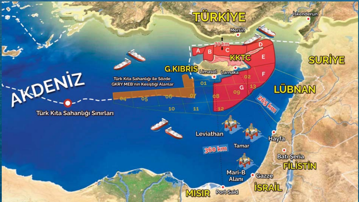
Tablo 1. Doğu Akdeniz Enerji Havzası

Bölgede atılan her yeni adımın dengeleri değiştirdiği bir ortamda İsrail, Mısır ve GKRY'nin diğer bölge ülkelerinin haklarını göz ardı ederek kendi aralarında ve uluslararası anlamda çeşitli anlaşmalar yapma çabaları mevcut gerginlikleri arttırmaktadır. Rum kesimi, enerjide ticaret merkezi olma ümidi ile Amerika Birleşik Devletleri (ABD)'nin de desteğini alarak 'Vasilikos Planı'nı (Tablo 2) gerçekleştirip bölgede bir LNG tesisi kurmayı amaçlamaktadır. Kurulacak LNG tesisiyle hem Afrodit sahasındaki doğalgazın hem de İsrail'in Leviathan sahasındaki doğalgazın buraya taşınarak işlenmesi planlanmaktadır. İşlenen bu enerji kaynaklarının döşenecek boru hatlarıyla Yunanistan'a taşınması ve buradan Avrupa pazarına ulaştır-