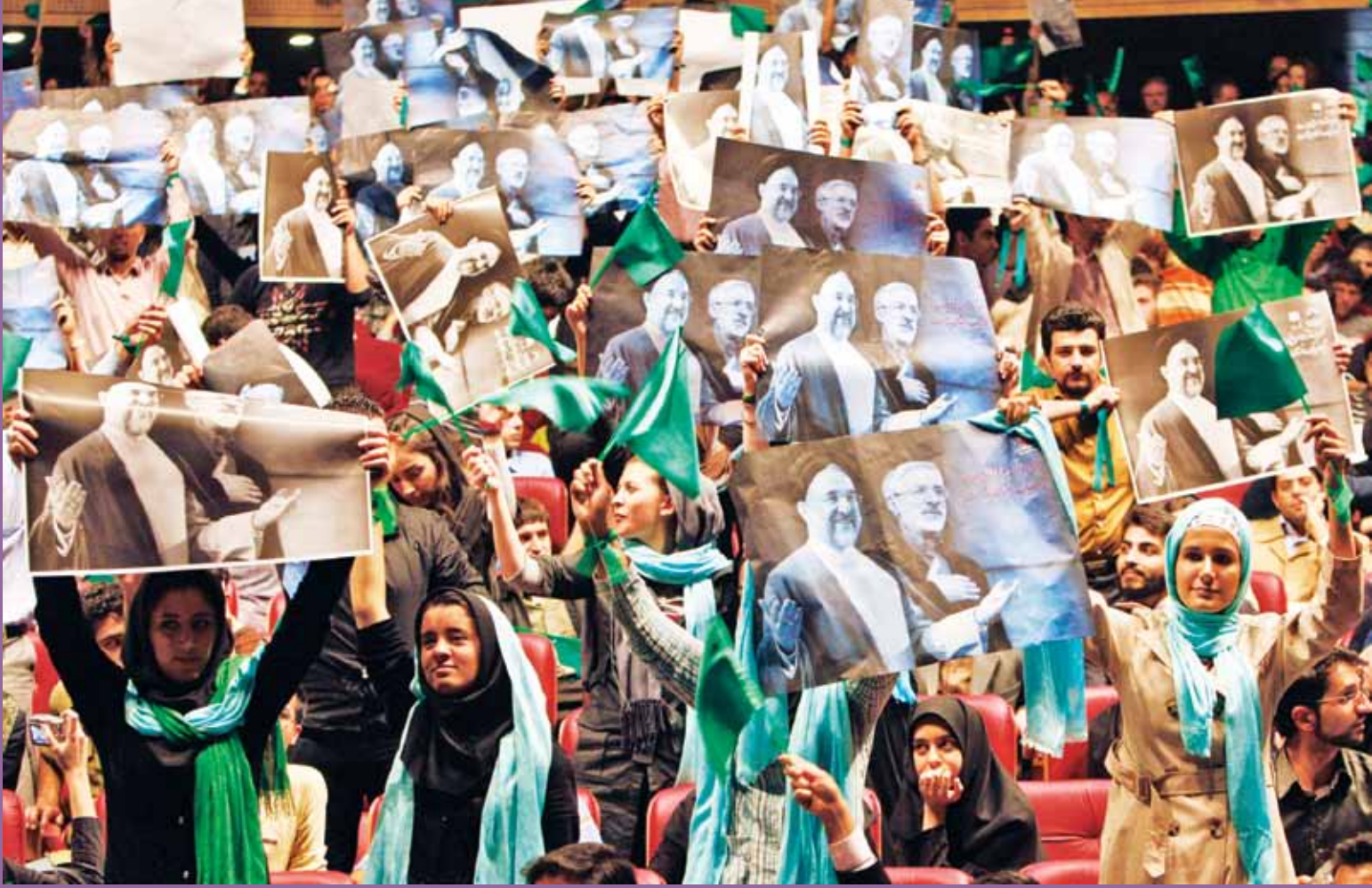
Son Başbakan Musevi ve eski Cumhurbaşkanı Hatemi'nin temsil ettiği Reformcu kanadın İran'daki sınıfsal temelleri halen zayıf.

liğe uğramadan günümüze kadar gelmiştir. Bu nedenle, 1989'dan beri Muhafazakâr-Reformcu oylaması, her seçimde değişik isimlerde somutlaşmış ama yarışın niteliği hep aynı kalmıştır. 2009'un somutlaşmış hali, Ahmedinejad-Musevi rekabetidir. Bundan da önemlisi, şimdiye kadar gerçekleşen seçimlerin sonucu ne olursa olsun; ister Reformcular yüzde 80 oyla kazansın, isterse Muhafazakâr adaylar ipi göğüslesin, İran'ın sınıfsal yapısının ürünü olan rejimin niteliğinde köklü değişiklikler yaşanmamıştır. Bu sefer de farklı olması için hiçbir neden yoktur. Yukarıda kısaca değindiğim üç unsurun yanın-