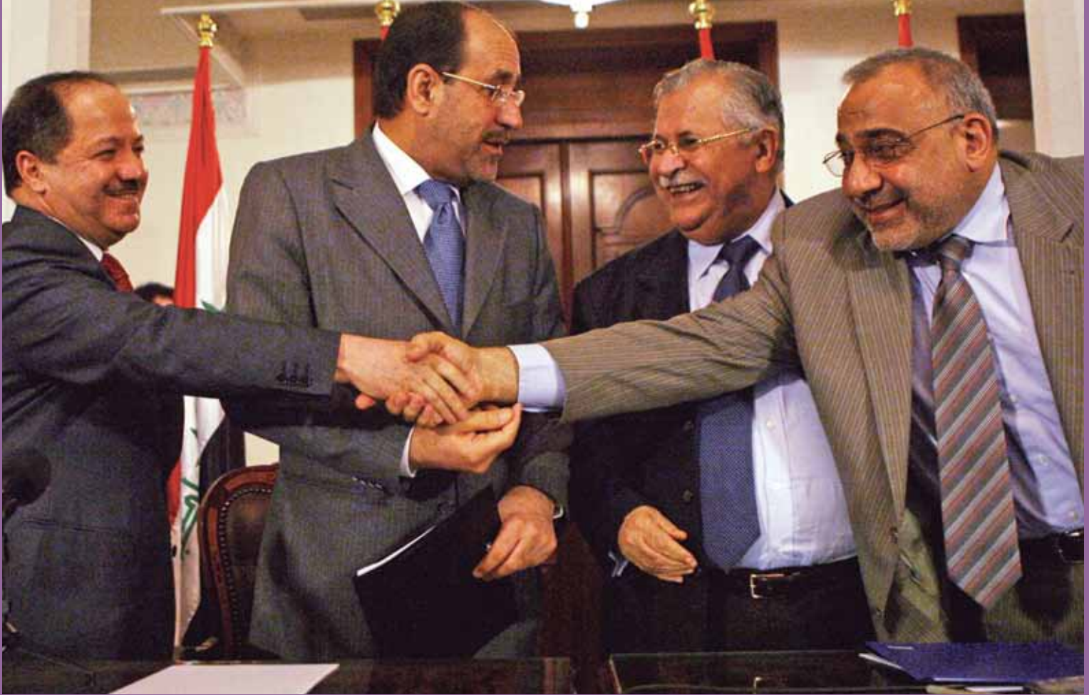
KDP-KYB ile İslamcı Şii partileri arasındaki eski koalisyonun yeniden kurulup kurulamayacağı merak konusu.

şabilmesi Irakıye'yi ülke çapında bir parti haline getirmiş, böylece Irakıye birçok vilayetten oy ve milletvekili alabilmiştir. Nitekim, seçimin kaderini belirleyen de bu olmuştur. Babil, Basra, Kerbala ve Vasit gibi Şii vilayetlerinde Irakıye yüzde 10 ve üzerinde oy almıştır. Bağdat'ta Baasçılar, milliyetçiler ve aşiretlerin güç birliği yapması bu koalisyonun neredeyse Maliki kadar oy ve milletvekili çıkartmasını sağlamıştır. Ama asıl sürpriz güneydedir. Çünkü güney Irak'ta kurmuş olduğu ittifaklar sayesinde Irakıye'nin çıkarttığı 12 milletvekili ona seçimin birinci partisi olma konumunu getirmiştir. Oysa Şiilerin çoğunlukta olmadığı vilayetlerde KDK bir, IUİ dört milletvekili çıkartabilmiştir. Eğer bu vilayetlerde Irakıye de geçmişte diğer "Sünnilerin" temsilcisi olan partilerin çıkartmadığı gibi milletvekili çıkarta-