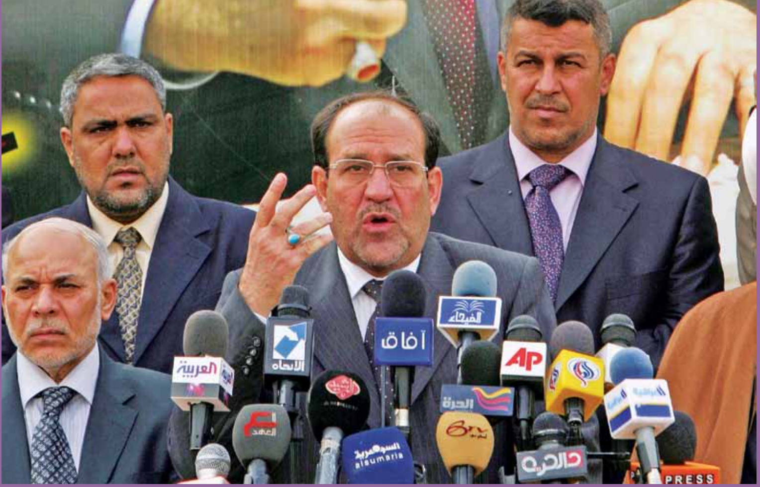
Başbakan Maliki seçimlerde az bir farkla Irakiye Listesi'nin gerisinde kaldı. Buna rağmen Maliki'nin başbakanlığı yeniden elde etme şansı halen yüksek.