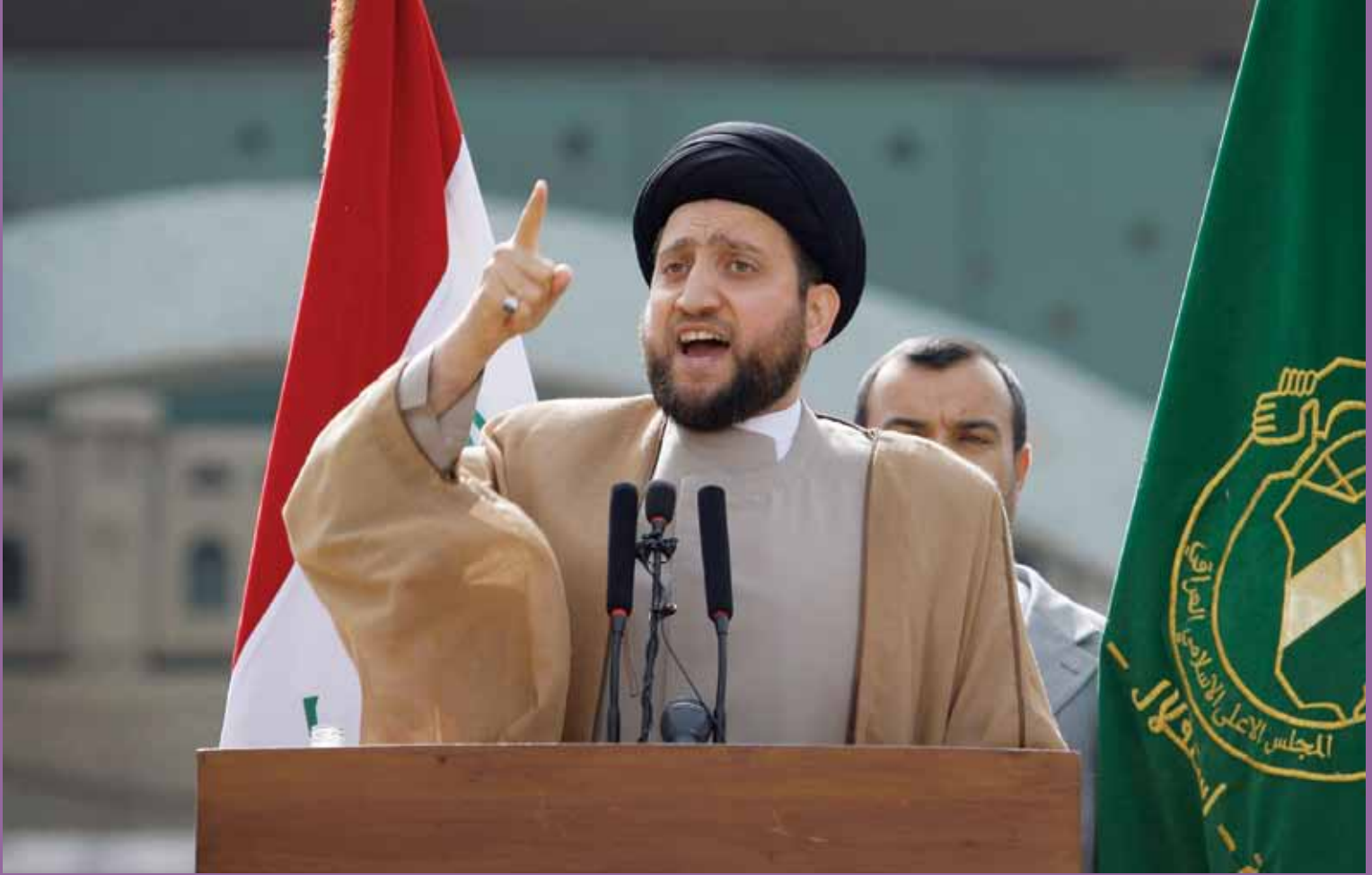
Irak İslam Yüksek Konseyi, son iki seçimde de beklediğini bulamadı ve Şii siyaseti içindeki dengelerde avantajlı konumunu yitirmeye başladı. Resimde, partinin lideri Ammar El Hakim görülüyor.

tilen ana nedene ek olarak Sadrcı hareketin bu ittifakın içinde olmasının nedeni olarak üç olgu daha gösterilebilir. Birincisi, ittifakın oluşumunda her iki örgütü de yakından destekleyen İran'ın oynadığı rol, ikincisi seçime tek başına girmenin yarar getirmeyeceğinin farkında olmaları, üçüncüsü de Maliki ve Sünni Araplara karşı bu iki hareketin birbirine ihtiyacı olmasıdır.