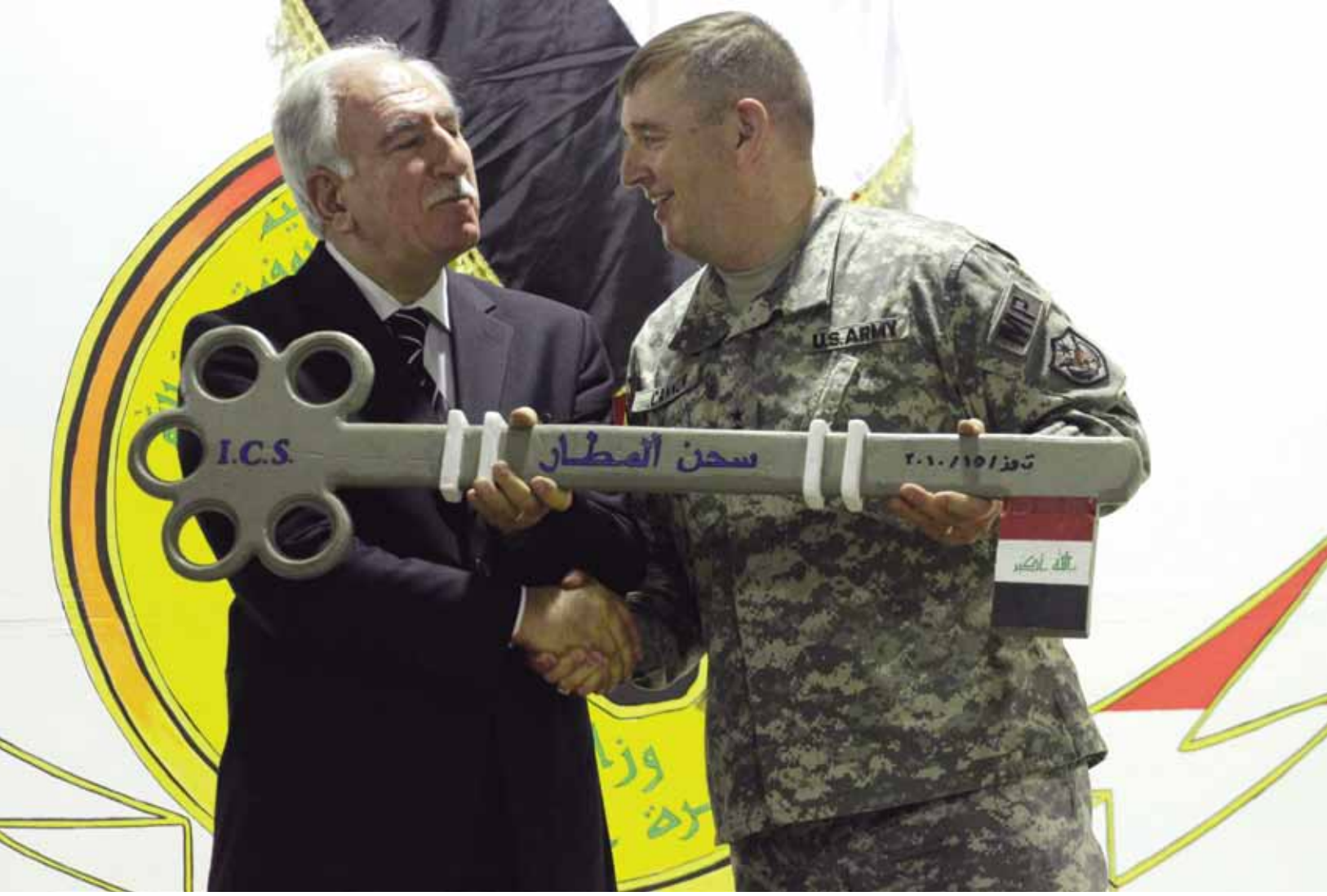
ABD'nin Irak'tan çekilmesinden en fazla hangi politik grupların zarar ya da kâr edeceği şimdilik belirsiz. Resimde, devir teslim törenindeki Irak Adalet Bakanı ve Amerikalı bir general görülüyor.

olarak bu çatışmayı başlatabilir. Fakat, merkezi otoriteyi tek elde toplamayı amaçlayacak olan bu türden bir şiddet kullanımı kabaca özetlenen şu koşullara bağlı olarak ortaya çıkabilir.