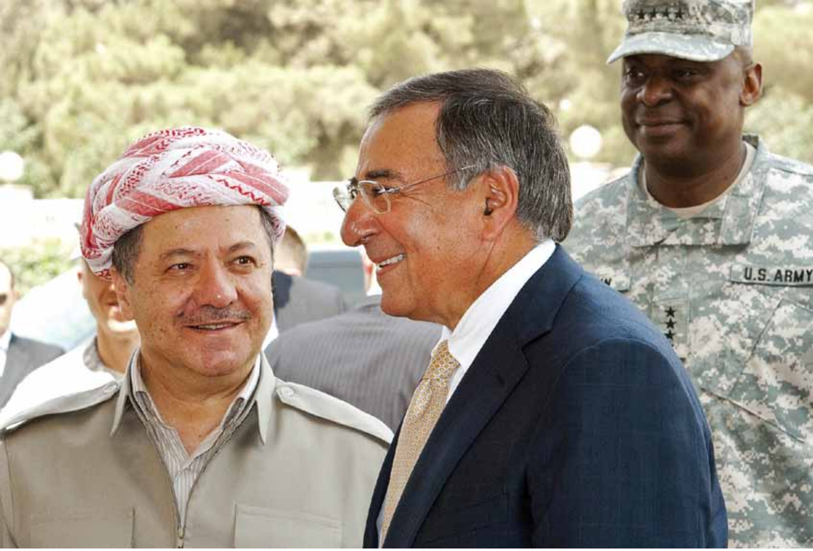
ABD Savunma Bakanı Panetta, geçtiğimiz Temmuz ayında Erbil’de KBY Başkanı Barzani’yle görüştü. ABD’nin Kürt bölgesinin geleceğiyle ilgili tutumu büyük merak konusu.

mektedir. Özellikle Irak’ın Arap kesimi devletin hala bir Arap devleti olduğunu, Kürtlerin devletin zayıflığından yararlanarak bugünkü noktaya ulaştıklarını düşünmektedir. Bu nedenle, aslında pek çoğu için bugünkü durum geçicidir. Bunun mevcut haliyle sürmesi doğru değildir. Özellikle, IKBY’nin Musul, Kerkük ve Diyala gibi vilayetlerde genişleme çabaları ve IKBY’nin otorite sahasını buralara genişletmesi kabul görmemektedir.