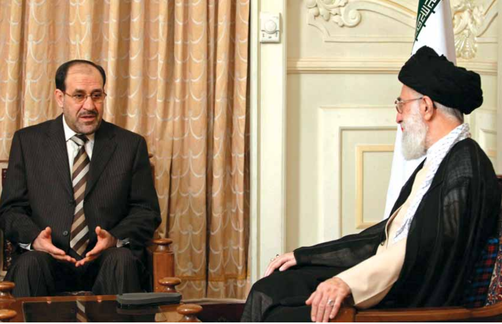
Ortaya çıkabilecek yeni Şii Arap devleti tek başına ve kendisine düşman devletlerle mücadele içine girmektense İran ile işbirliği yapacaktır. Resimde Başbakan Maliki, Tahran'da Rehber Hamaney ile görüşüyor.

karmaşık bir ittifaklar ya da ilişkiler ağı oluşabilecektir. Bu tür bir senaryonun gerçekleşmesi halinde Türkmenlerin içinde bulunacağı durum da son derece tehlikelidir. Türkmenler Kürtler ile Araplar arasındaki savaşın ortasında kalabileceği gibi aynı zamanda kendi içlerindeki mezhepsel ayrım nedeniyle birbirlerine de düşebilirler.