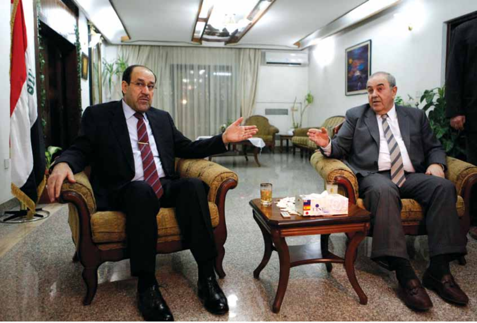
Irak'ta merkezîyetçiliğin halen güçlü bir eğilim olduğu, seçimden ilk iki sırada çıkan Irakiye ve Kanun Devleti Koalisyonu'nun politikalarında da görülebilir. Resimde bu grupların liderleri Maliki ve Allavi görülüyor.

Yukarıdaki ana eksen temel alınarak bugünkü Irak'ın durumu şöyle tasvir edilebilir: Irak, top- rak bütünlüğünü korumakla birlikte, merkezi hükümetin kuzeyde (Kuzey'den kasıt, İKBY'nin resmi sınırları olan Duhok, Süleymaniye ve Erbil vilayetinin sınırlarını kapsadığı kadar, Irak merkezi hükümetinin veya ilgili vilayet meclislerinin filli kontrolünün olmadığı Musul'un kuzeyindeki bazı ilçeler ve Kerkük'ün bir kısmını da kapsamaktadır.) otoritesinin olmadığı, ülkenin orta kısımlarında sorunlar yaşadığı, güneyde ise Şii-lerin çoğunlukta olduğu vilayetlerde güçlendiği, kendi içindeki temel anlaşmazlıkları çözememiş, etnik ve dini gruplar arasındaki siyasi rekabetin tarihsel nedenlerin de etkisiyle gruplararası düşmanlığa dönüştüğü, dış güçlerin etkilerine büyük ölçüde açık geçiş sürecinde bir ülkedir.