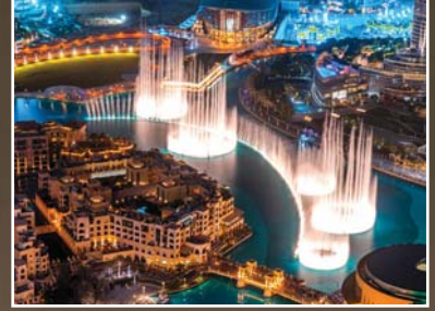
Figür 1. Bir uzay şehri mi, Batı kenti mi, Dubai mi?

Dubai bu arzunun mekânsal izdüşümüdür. Nitekim Dubai "altının şehri" olarak bilinmektedir. Her şeyin altın kaplamalı olduğu ve altın nispetinde değer bulunduğu tuhaf bir dünya.