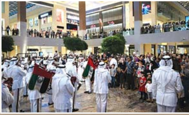
Figür 2. UAE'nin ulusal bayram kutlaması. Mekân bir AVM.

Geleneksel dansları ve müzikleriyle de öne çıkan bu coğrafya, şayet internete girilip bakılırsa, folklorik tasarımda da yine çöllerin kumuyla geniş beton yolları buluşturmuştur. Öyle ki modern oyunların yeni mekânı AVM'ler olmuştur. Buna rağmen, Batılı gözüyle tümüyle tatmin etmeyi de başaramamıştır. Zira bir zamanlar fakir ve kaba olan Arap imajı, bu kez zengin ve görgüsüz Arap imajına evrilmiş olarak kabul görmüştür.