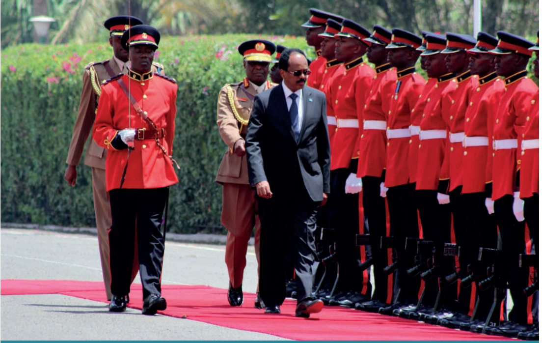
Somali Devlet Bařkanı Muhammed Abdullah Farmajo 23 Mart 2017 tarihinde Kenya Devlet Bařkanı Uhuru Kenyatta tarafından resmi trenle karřıldı.

zaman gerekleřen ayrılıkçı hareketlere de Kenya devleti sert mdahalede bulunmuřtur.