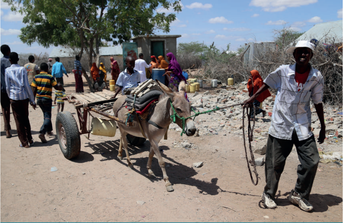
Dadaab mülteci kampında yaşayan Somalili mülteciler, 4 Ekim 2014'te Kenya'nın Nairobi kentinde yaşanan su krizinden dolayı temiz su sağlamak için yürüyor.