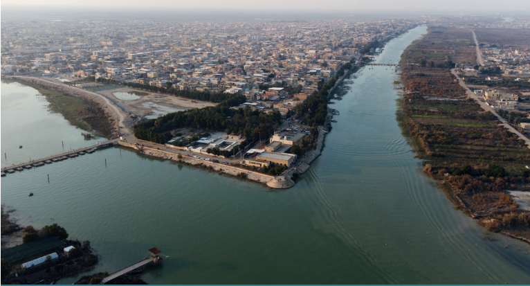
Kamu hizmetlerindeki eksiklikler Basra'daki seçim temalarının başında gelmektedir.

Gençlik hareketlerinin seçim sürecine etkisi de belirgin bir tematik unsur olarak öne çıkmıştır. Son yıllarda artan toplumsal protestoların etkisiyle, reformcu adaylara ve bağımsız listelere olan ilgi yükselmiştir. Bu yeni dalga özellikle önceki siyasi süreçlerden dışlanmış veya umutsuzluğa kapılmış genç seçmenler için bir alternatif kanal sağlamıştır. Gençlik tabanlı bu yönelim, siyasetin geleneksel yapılarına karşı bir tepki olarak ortaya çıkmıştır.