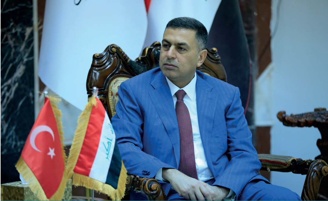
Basra Valisi Esad el-İdani

alanda da etkili aktörler olarak işlev gördüğünü ortaya koymaktadır. Bu bağlamda Basra'daki ön plana çıkan aşiret aktörlerini gösteren tablo aşağıda yer almaktadır.