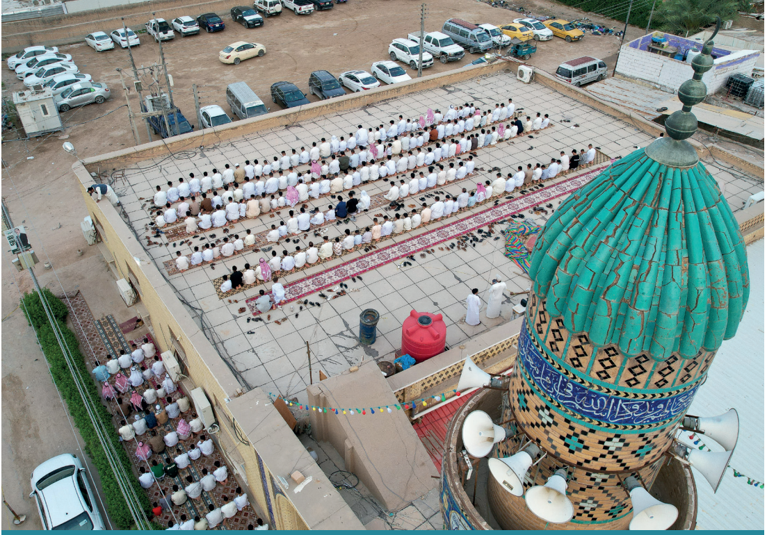
Irak'ın Basra Valiliğine bağlı ez-Zubey kentindeki Müslümanlar, Ramazan Bayramı namazını rr-Raşidiye Camii'nde kıldı.

mektedir. Irak Parlamentosunda 25 sandalye ile temsil edilen vilayet, yerel dengelerin ulusal siyaset üzerindeki etkisini artırmaktadır. Seçim süreçlerinde gerek aşiret yapılarının mobilizasyonu gerekse gençlik hareketlerinin yükselişi, Basra'nın yalnızca bir petrol ve ekonomi kenti olmadığını göstermektedir. Basra aynı zamanda siyasi rekabetin yoğunlaştığı bir merkez olarak öne çıkmaktadır.