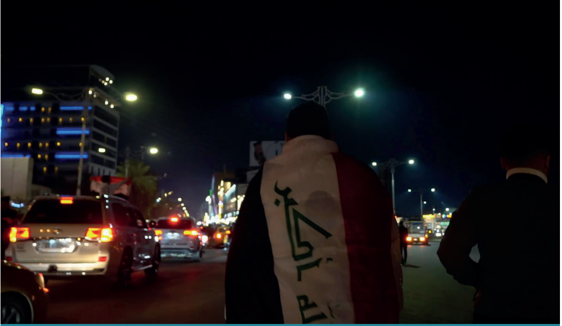
Basra, 2023 yılında 25. Körfez Ulusları Kupasına ev sahipliği yapmıştır.

tir. Seçim sonuçları da bu tematik eğilimlerin etkilerini somut biçimde yansıtmıştır.